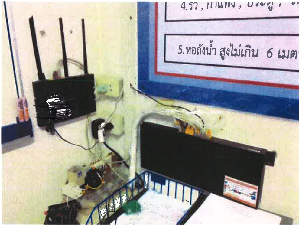
ห้องประชุม อบต.ตอยงาม