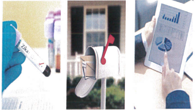
ฐานประโยชน์สาธารณะ (มาตรา 24(4)) หรือประโยชน์โดยชอบด้วยกฎหมาย (มาตรา 24(5))